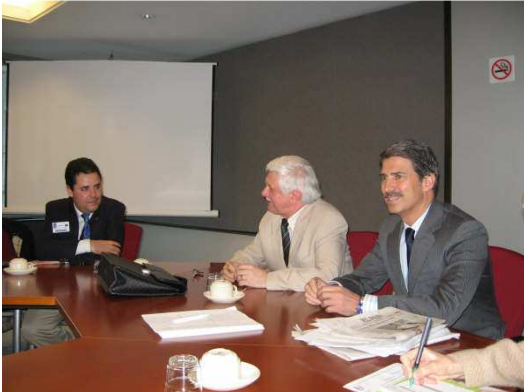
Con los diputados al Parlamento Europeo Zbigniew Zaleski (Polonia) e Ignacio Salfranca (Ex Presidente de Paneuropa España).

Arriba vemos una fotografía del encuentro con el Diputado al Parlamento Europeo Agustín Díaz de Mera, que fue Director General de la Policía y Alcalde de Ávila.