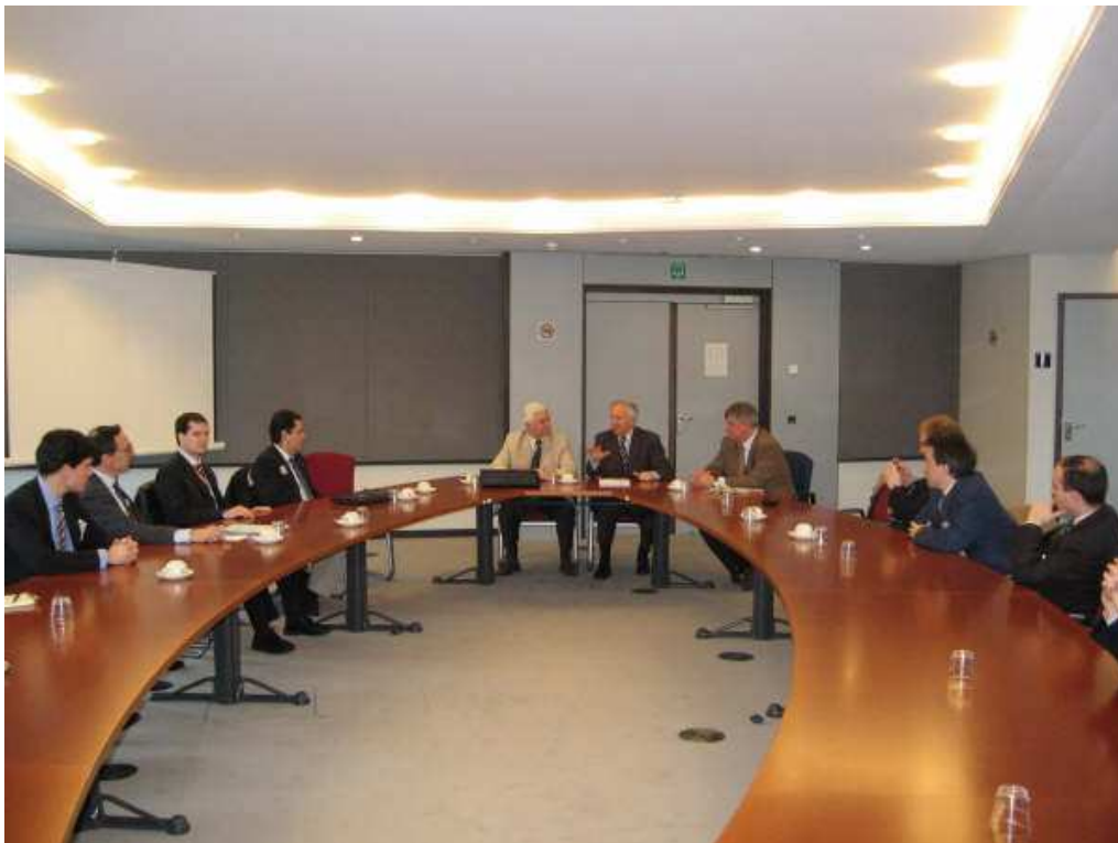
Reunión en el Parlamento Europeo con Ingo Friedrich (Vice-Presidente del Parlamento Europeo y Vice-Presidente de Paneuropa Internacional).