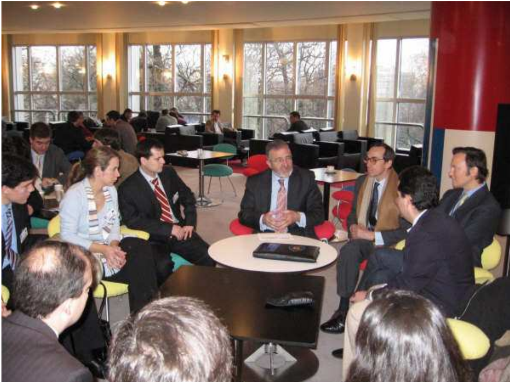
Encuentro con el Diputado al Parlamento Europeo, Agustín Díaz de Mera, que fue Director General de la Policía y Alcalde de Ávila.